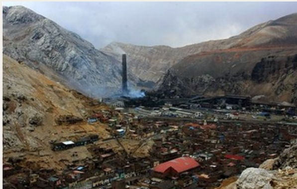
La Oroya Antigua - vista de la ciudad y Fundición - 2008